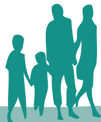
Table Ronde 1 Les réseaux : quels contours ? Quels acteurs ?

Intervenant : M. Raphaël RICARDOU (Sociologue)