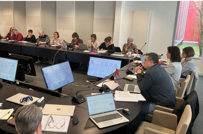
Réunion de présentation de la circulaire auprès des directions des centres sociaux.

Parue en décembre 2025, une nouvelle circulaire actualise la doctrine nationale de l'Animation de la Vie Sociale. Elle propose de consolider le rôle des centres sociaux comme acteurs majeurs du lien social et réaffirme les fondamentaux qui font l'Animation de la Vie Sociale (cohésion, inclusion, socialisation, citoyenneté, capacitation...) mais aussi ses principes forts tels que la mobilisation des habitants, en particulier dans la gouvernance, ou encore l'attention aux publics éloignés. Cette circulaire sera effective au 1er janvier 2027. Elle a vocation à être déployée en lien avec les enjeux des territoires, via les Conventions Territoriales Globales.