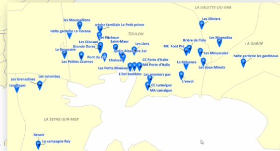
Carto 2 : Crèche Avip au 1 er septembre 2023