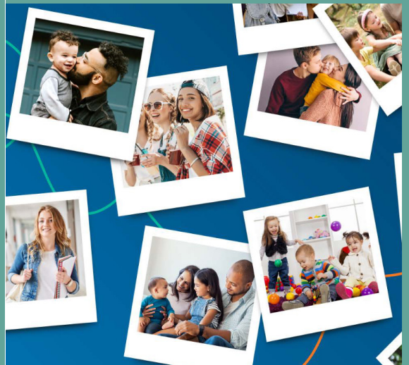
Schéma Départemental des Services aux Familles