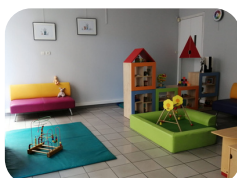
Espaces de jeux de 0 à 99 ans