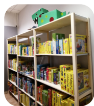
Espace de prêt