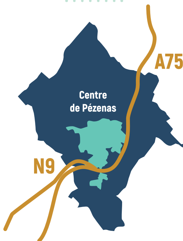
Carte de Pézenas