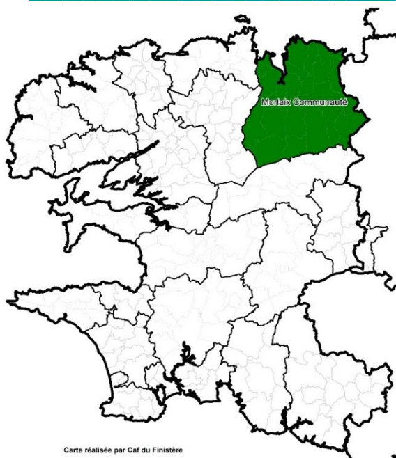
Carte réalisée par Caf du Finistère

CA Morlaix Communauté se compose de 26 communes