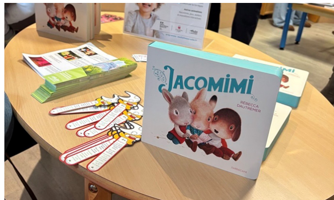
«Jacomimi» de Rébecca Dautremer aux éditions Sarbacane

Pour la Caf, ce projet s'inscrit dans une volonté forte : soutenir la parentalité et proposer des ressources concrètes pour répondre aux besoins des familles du territoire. La collaboration étroite avec le Département illustre une ambition commune : offrir un environnement bienveillant et structuré dès la naissance de chaque enfant.