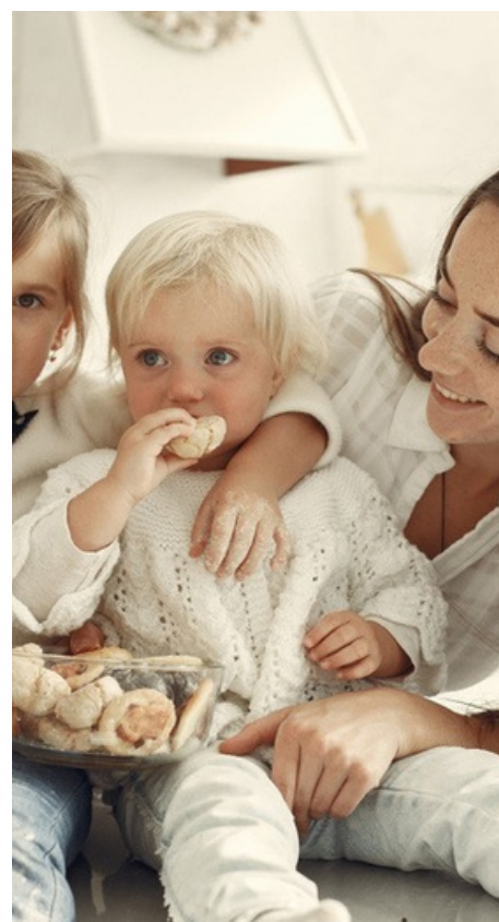
Aide aux familles fragilisées