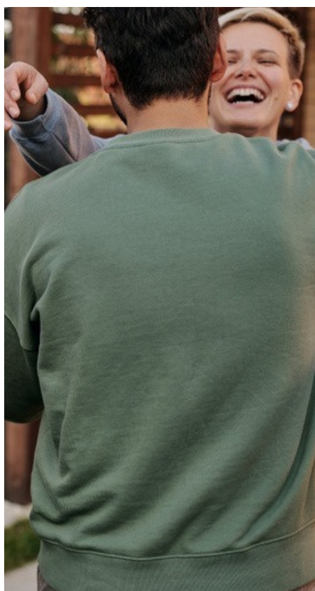
Prêts et aides d'action sociale