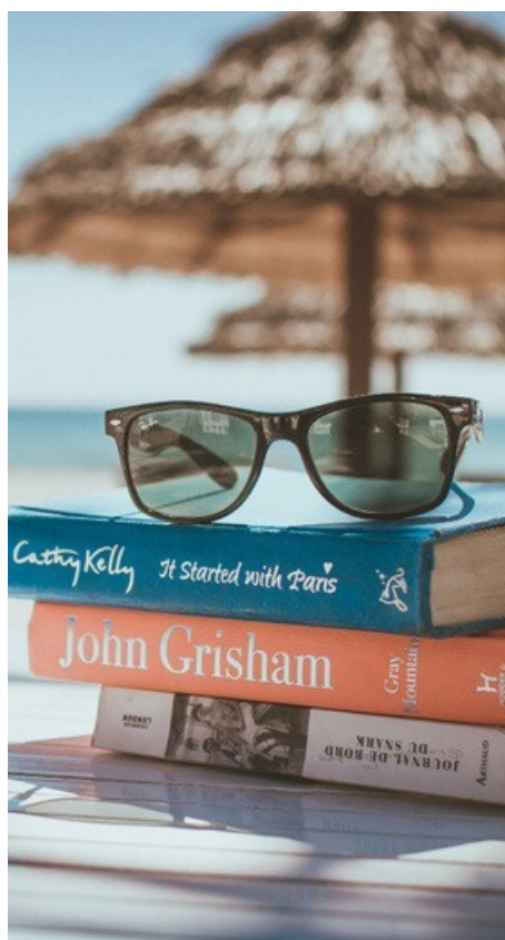
Aides aux temps libres

Plateforme téléphonique Caf, Accueil et Partenaires