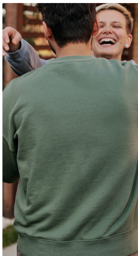
Prêts et aides d'action sociale