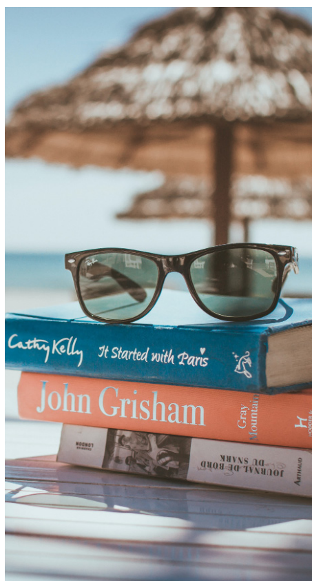
Aides aux temps libres