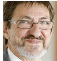
Jean-Louis Deroussen, président du Conseil d'administration de la Cnaf

2016. L'entrée en vigueur de la Prime d'activité, l'occasion de promouvoir l'inclusion numérique.