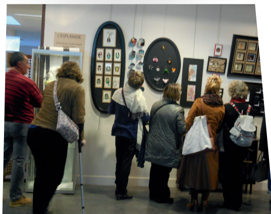
Vernissage d'une exposition proposée par l'Amicale Laïque Centre Socioculturel de St-Yrieix

Les données chiffrées sont issues de l'observatoire SENACS – Données 2018