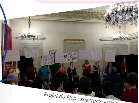
Projet du Flep : spectacle « Dis femmes »

Elles ont rassemblé 457 habitants de tous les âges et 20 professionnels.