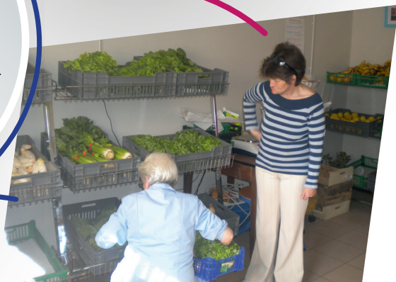
Epicierie sociale de la MJC Saint-Michel les associations viennent en aide aux personnes fragiles

Des bénévoles engagés, des savoirs partagés !