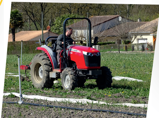
Un chantier d'insertion en maraichage bio

Les données chiffrées sont issues de l'observatoire SENACS – Données 2018