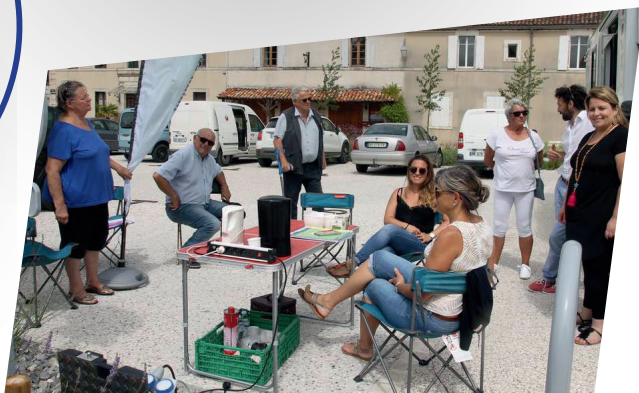
Le family bus ici à Brossac

Le Centre Socioculturel travaille avec l'association des commerçants et l'office du tourisme pour promouvoir le lien social (AfterWorks, Boutiques éphémères à Noël, Family Bus sur les Marchés...)