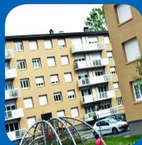
Difficultés pour régler le loyer