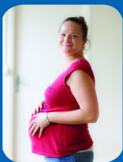
Naissance d'un premier enfant