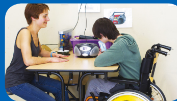
Maladie ou handicap d'un enfant