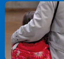
Décès du conjoint ou d'un enfant